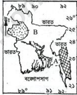
চিত্র : বাংলাদেশের দুটি ক্ষুদ্র জনগোষ্ঠীর বসবাসকারী অঞ্চল